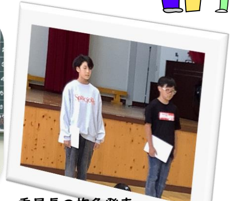
委員長の抱負発表