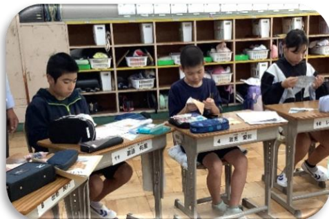
パッチワーククラブ