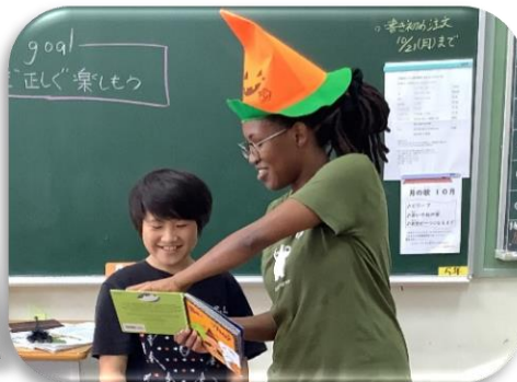
ハロウィンを正しく楽しもう